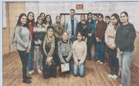
A visit to radio station by GNKCW students